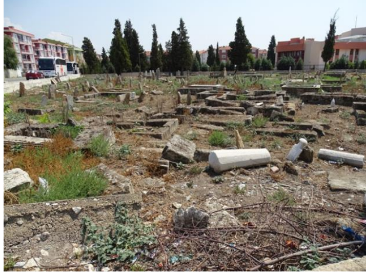
Resim 4: Kırklareli Eski Mezarlığı, günümüzdeki hali