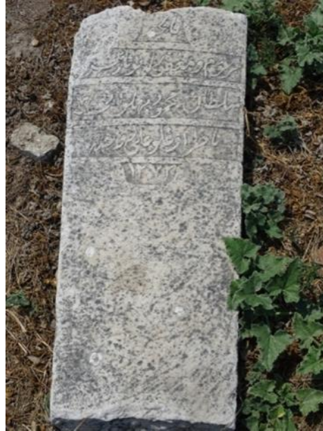
Resim 5: Pehlivan Ali'nin mezar taşı