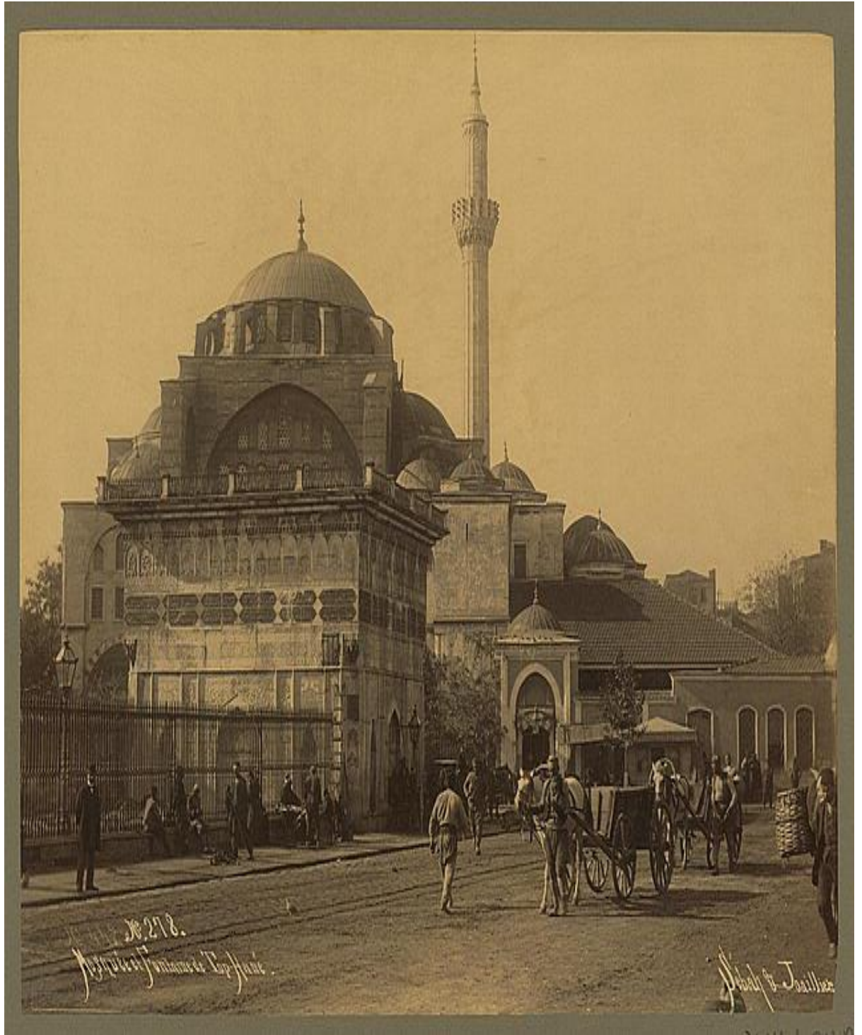
Kılıç Ali Paşa Cami