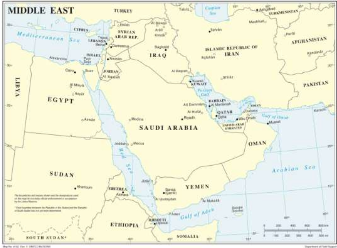
Harita 1: Orta Doğu Haritası

Kaynak: The Middle East Map, 4102 Rev. 5, United Nations