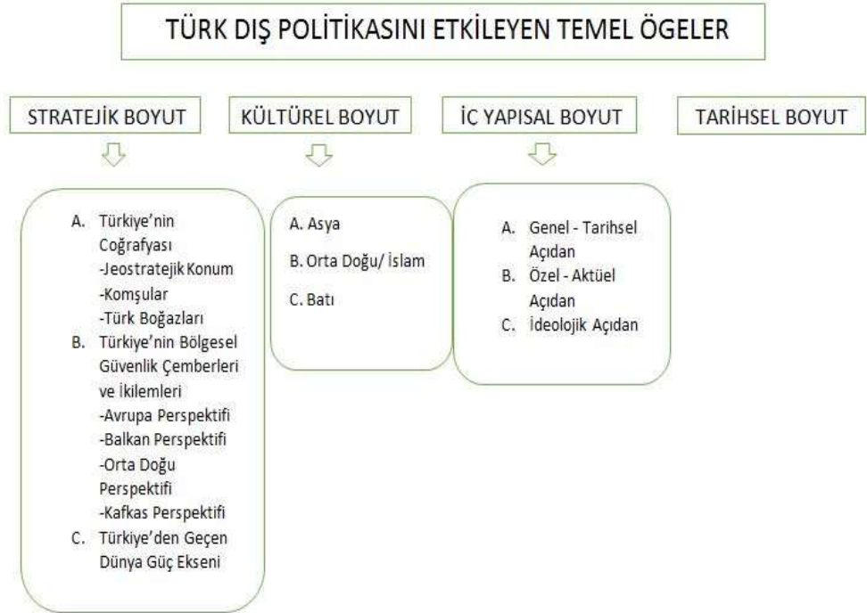
Tablo 1: Türk Dış Politikasını Etkileyen Temel Ögeler

Bu tablo yazar tarafından Baskın Oran'ın çalışmasına istinaden hazırlanmıştır.