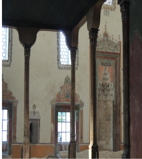
Fot.16. İbrahim Paşa Camii kible duvarında bezemeli sakal-ı şerif nişi