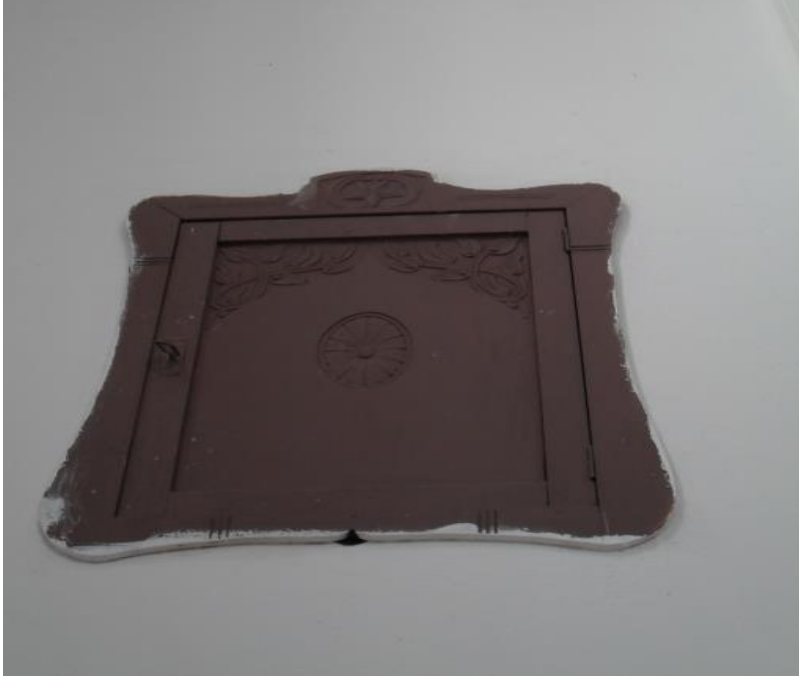
Fot.12. Hayriye Camii muhafaza dolabı kapağında detay