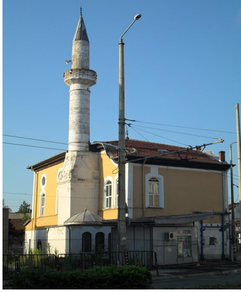
Fot.5. Rusçuk'ta Said Paşa Camii