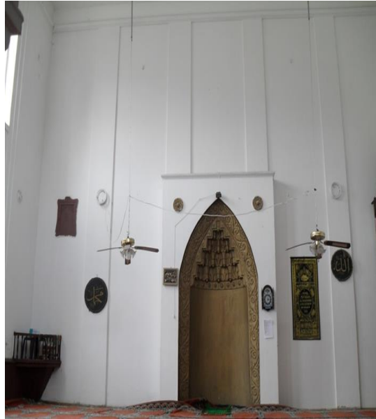
Fot.11. Hayriye Camii hariminde muhafaza dolabı