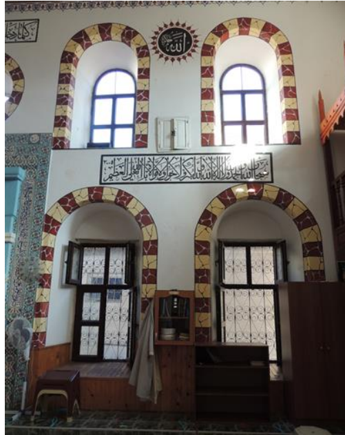
Fot.4. Kırcaali Camii hariminde sakal-ı şerif muhafaza dolabı