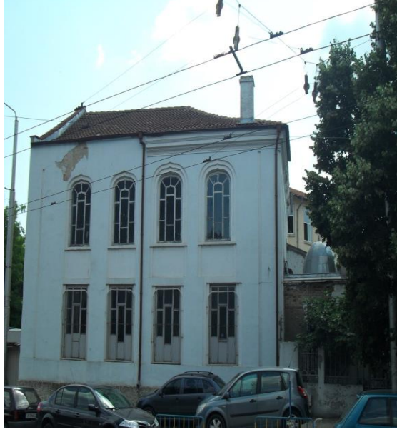
Fot.10. Varna'da Hayriye Camii