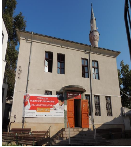
Fot.3. Kırcaali Camii