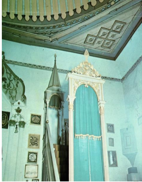
Fot.6. Said Paşa Camii harimi güneybatı köşesinde sakalı şerif muhafaza dolabı