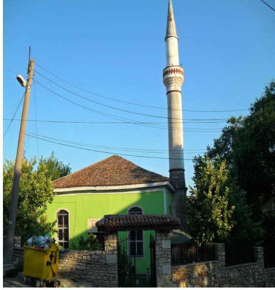
Fot.8. Balçık'ta Turgut Reis Camii