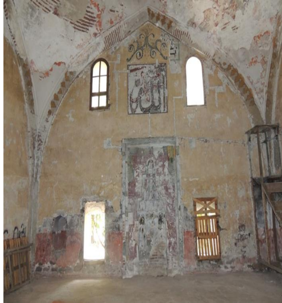
Fot.14. Karloğlu Ali Bey Camii kible duvarı ve boş muhafaza nişi