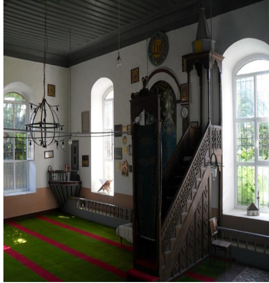
Fot.9. Turgut Reis Camii harimi ile kürsü hizasında muhafaza dolabı