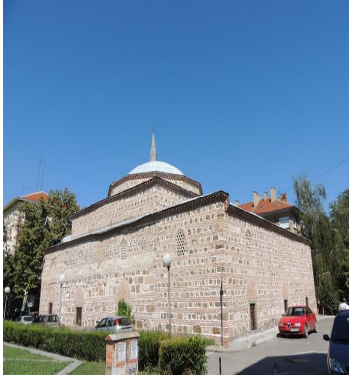
Fot.7. Yanbolu Eski Camii