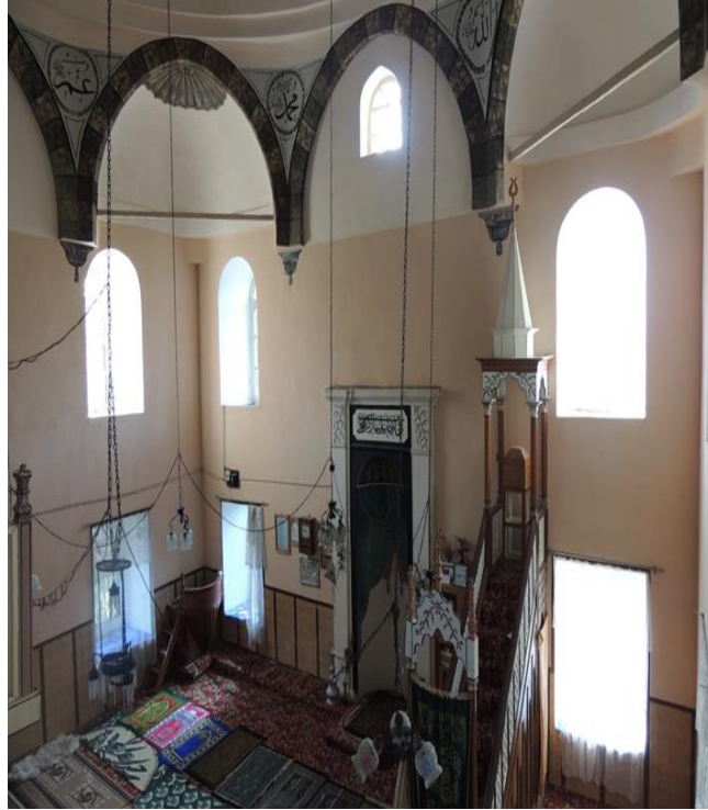
Fot.2. Amca Hasan Ağa Camii harimi ve sakal-ı şerif muhafaza sandığı