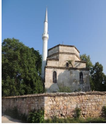
Fot.1. Kozluca'da Amca Hasan Ağa Camii