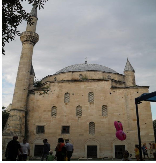
Fot.15. Hezargrad'da İbrahim Paşa Camii